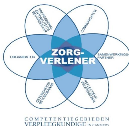
Figuur 1. Rollen verpleegkundige in CanMEDS

De stage heeft een prominente plaats in het curriculum van de opleiding Verpleegkunde Hogeschool Rotterdam. Het opleidingsprofiel van de verpleegkundigen 4 gebruikt een ordening in zeven rollen (zie figuur 1), 16 competenties en bijbehorende kernbegrippen, gebaseerd op de systematiek van de CanMEDS. Kern van de beroepsuitoefening is de verpleegkundige in de rol van zorgverlener. Alle andere rollen raken aan die centrale rol.