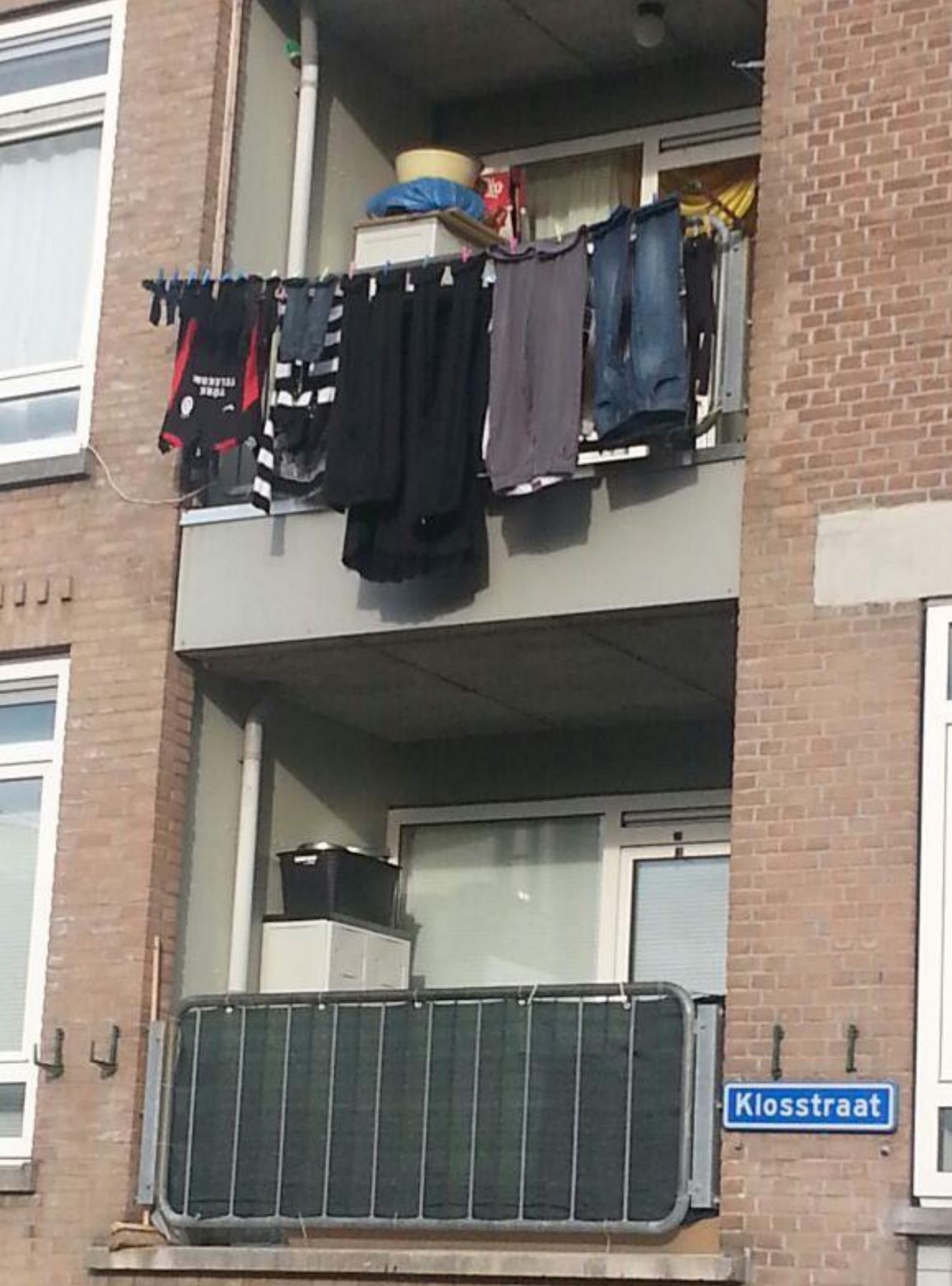
Figuur 1. Klosstraat Hillesluis, 2013