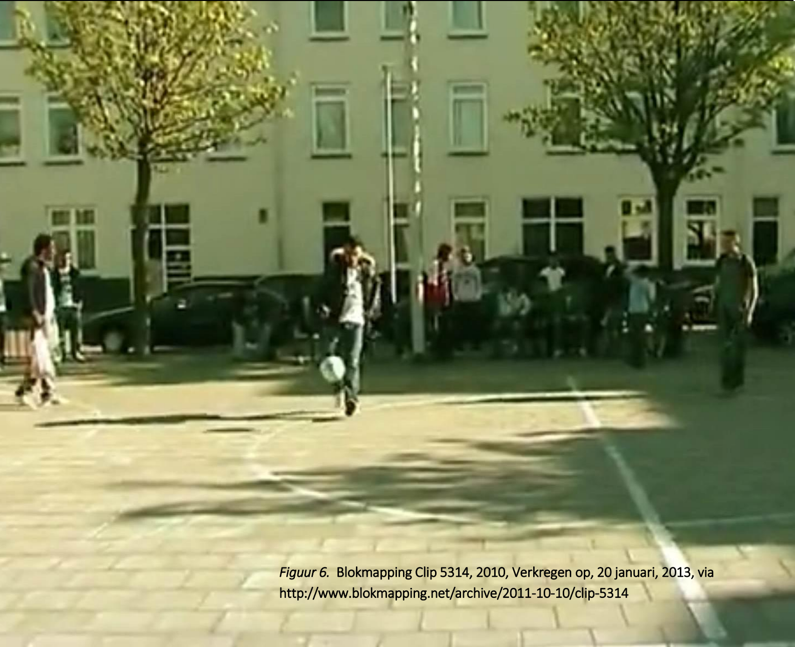
Figuur 6. Blokmapping Clip 5314, 2010, Verkregen op, 20 januari, 2013, via http://www.blokmapping.net/archive/2011-10-10/clip-5314