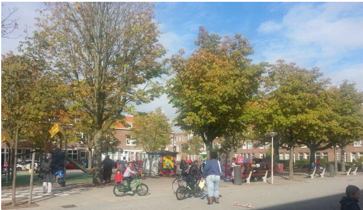
Figuur 4. Stichtseplein Hillesluis, 2013

Vanwege bovenstaande heeft Hillesluis plekken in de openbare ruimte met bepaalde functies. Zo functioneert bijvoorbeeld het Stichtseplein sinds enkele jaren als familieplein. Op het plein kan gevoetbald worden en onder andere TOS organiseert activiteiten. Kinderen van twaalf jaar en ouder worden gemotiveerd gebruik te maken van het Cruyff Court, waar ook sportactiviteiten onder begeleiding georganiseerd worden, maar, waar tevens zelf-georganiseerde voetbalpartijen mogelijk zijn. Op het Brabantseplein ligt een basketbalveld waar bewoners deze sport kunnen beoefenen (Deelgemeente Feijenoord, 2010b; Van de Wal, Müller & Gijsbers, 2009).