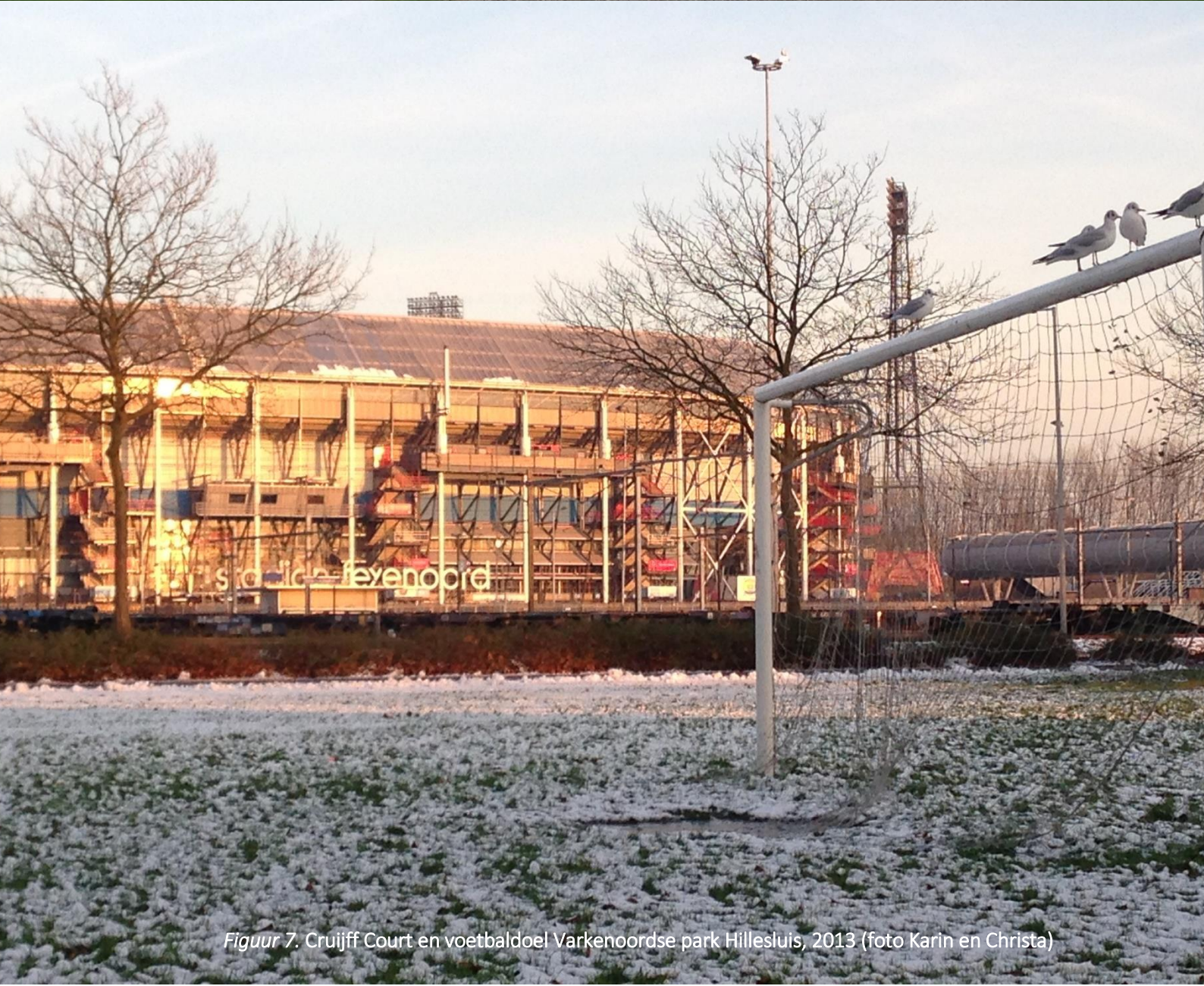
Figuur 7. Crujff Court en voetbaldoel Varkenoordse park Hillesluis, 2013