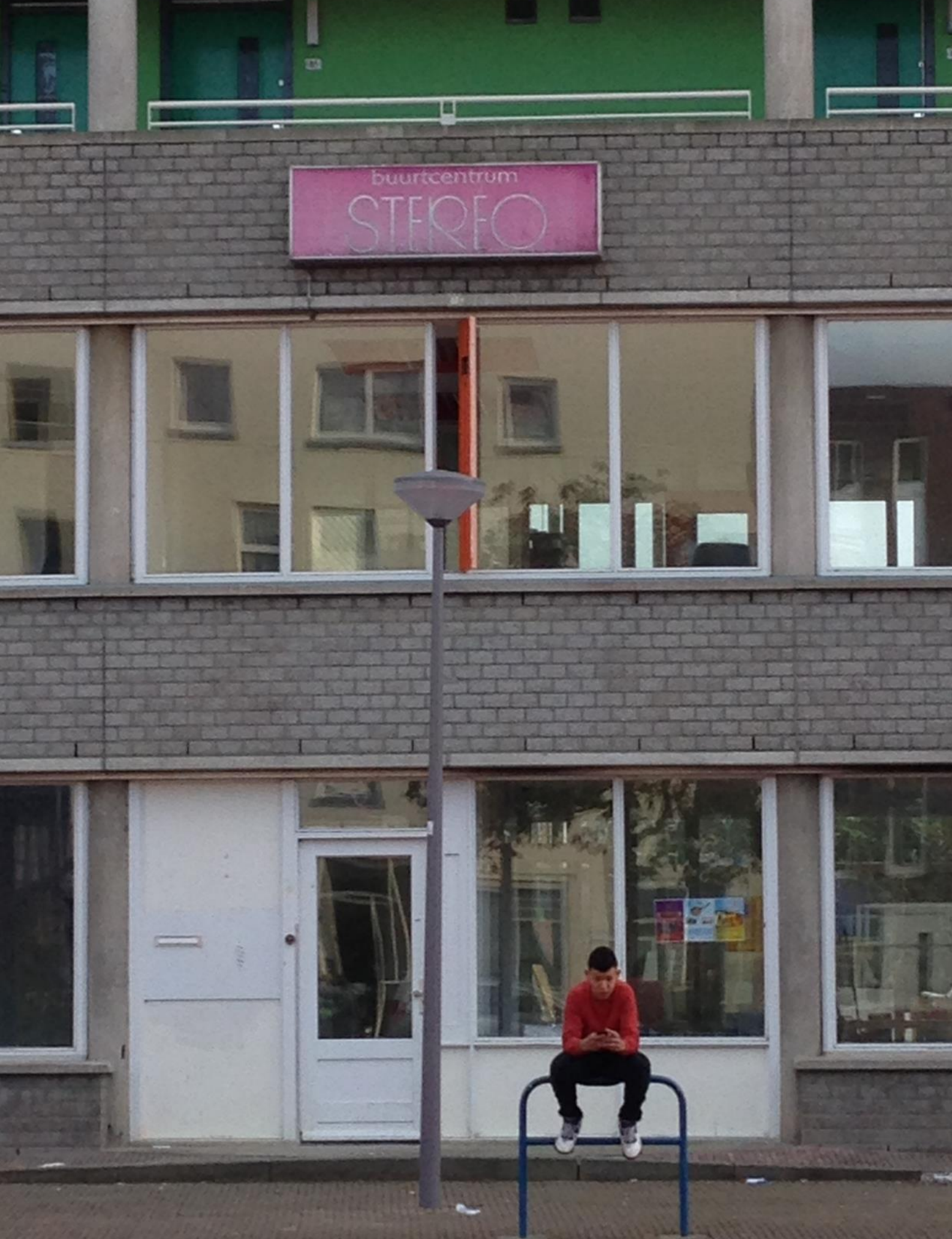
Figuur 8. Brabantseplein Hillesluis, 2013